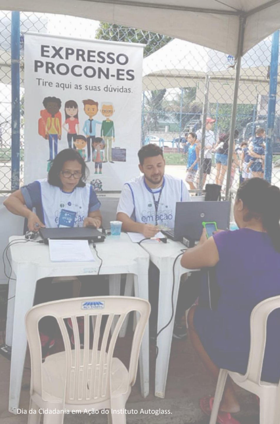
Dia da Cidadania em Ação do Instituto Autoglass.